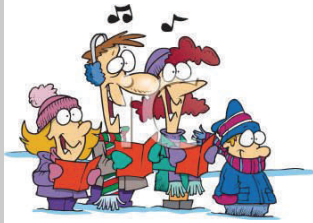
5. La familia